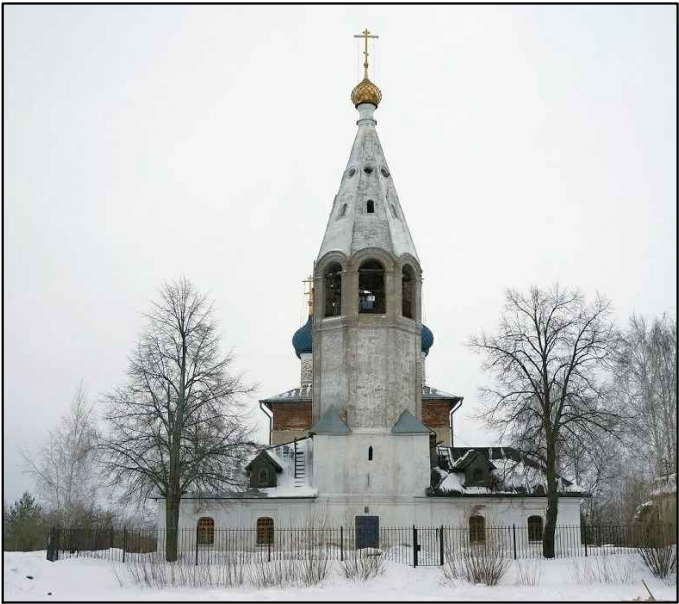
Объект культурного наследия