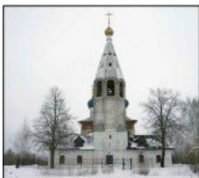
Объект культурного наследия